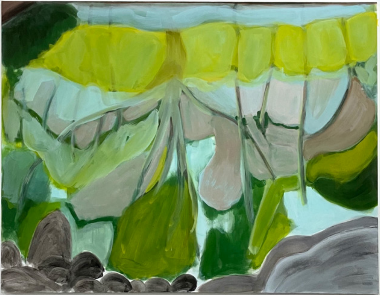
Vue d'atelier , 2026 Cire saponifiée, Pigments