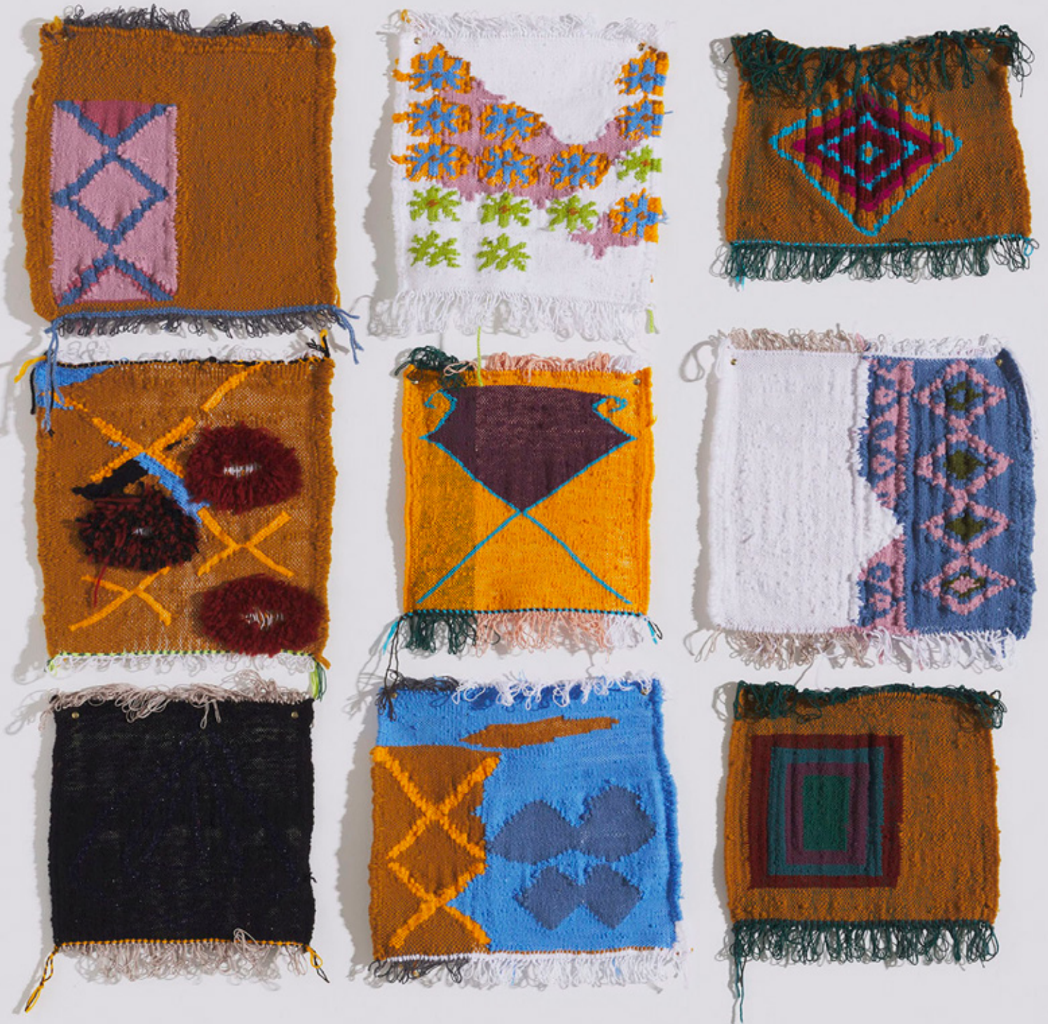
VUE D'ATELIER, 2023