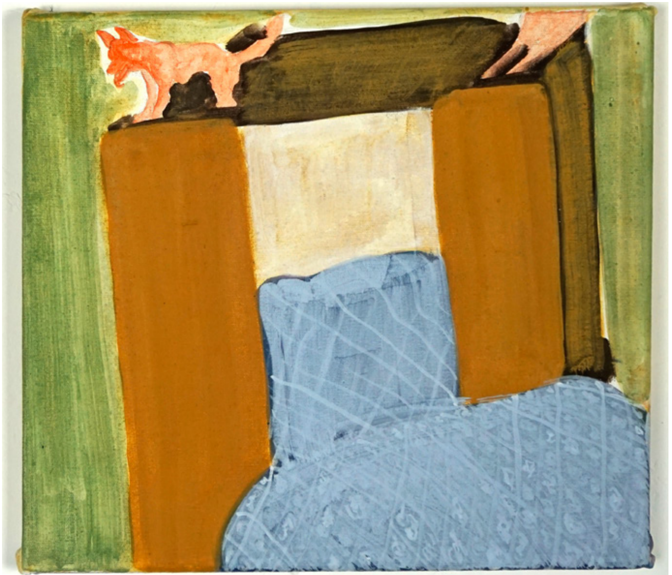
SANS TITRE, ACRYLIQUE SUR TOILE, 27 X 30 CM, 2018 Collection privée