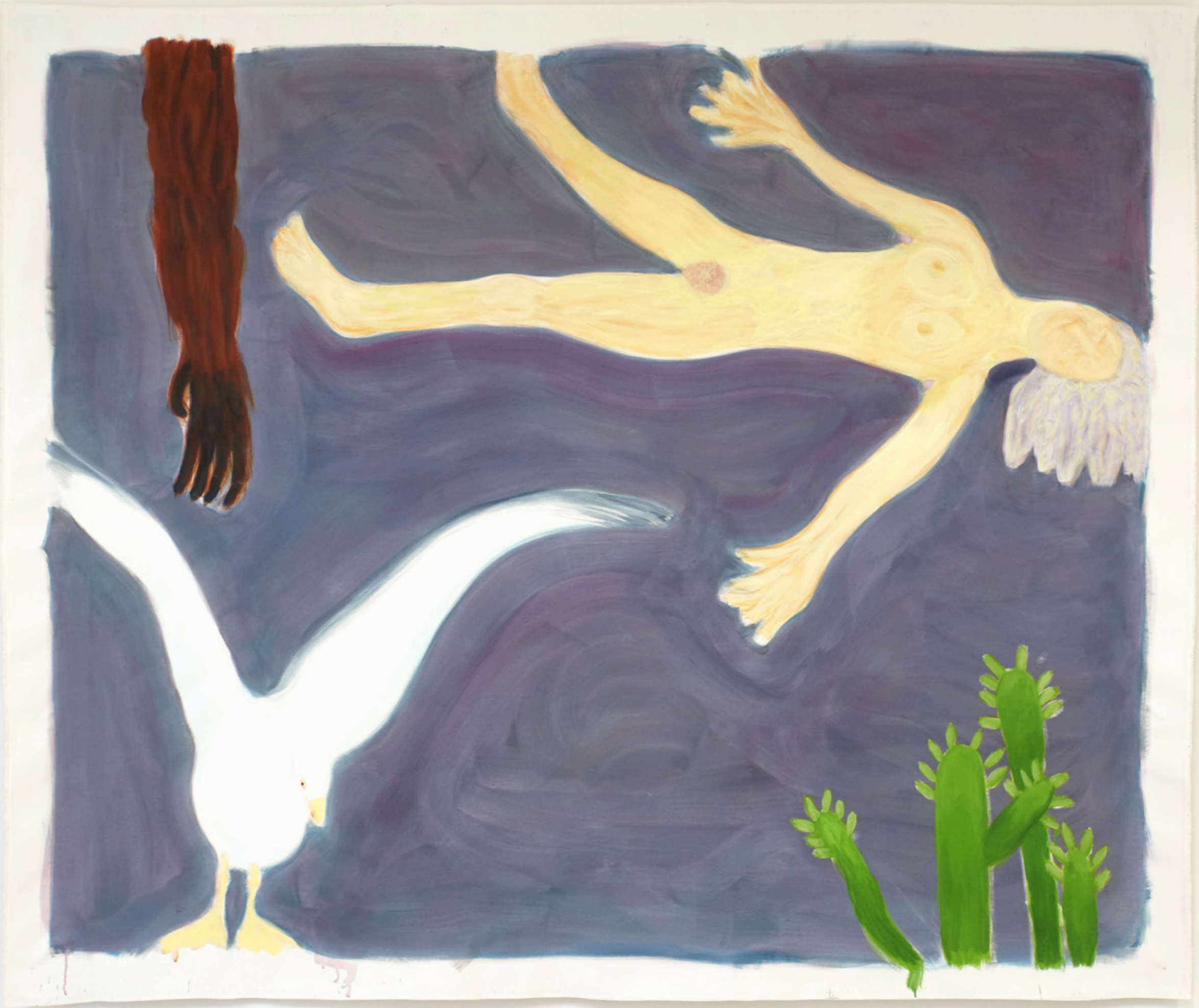
(Autoportrait avec animaux) SANS TITRE, ACRYLIQUE SUR TOILE, 180 X 210CM, 2018