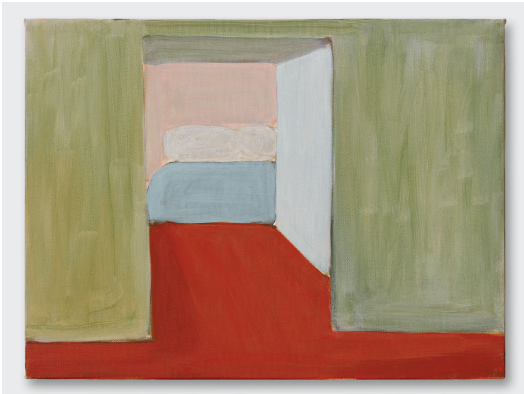
(Intérieurs) Sans Titre, 2024, Acrylique sur toile, 46 x 61 cm Collection privée