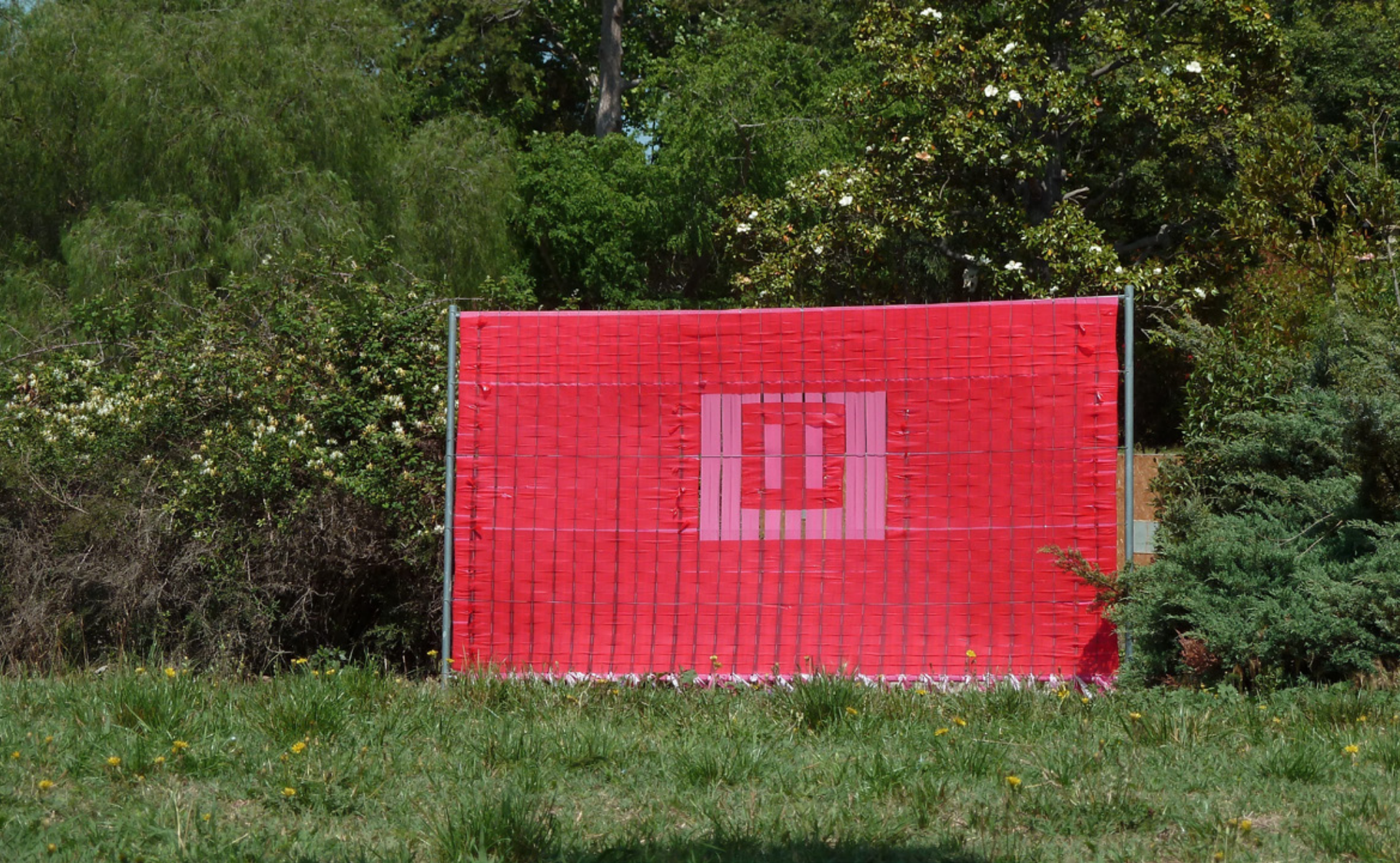
ARTS EPHÉMÈRES, PARC DE MAISON BLANCHE MARSEILLE JUIN 2023 IMPROMPTU, TISSAGE DE RUBALISE SUR GRILLE HERAS , 15 X 2 M