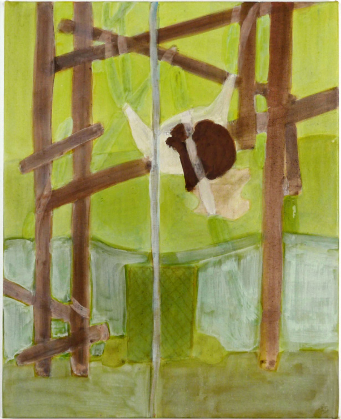
ACRYLIQUE SUR TOILE, 46 X 38 CM, 2017