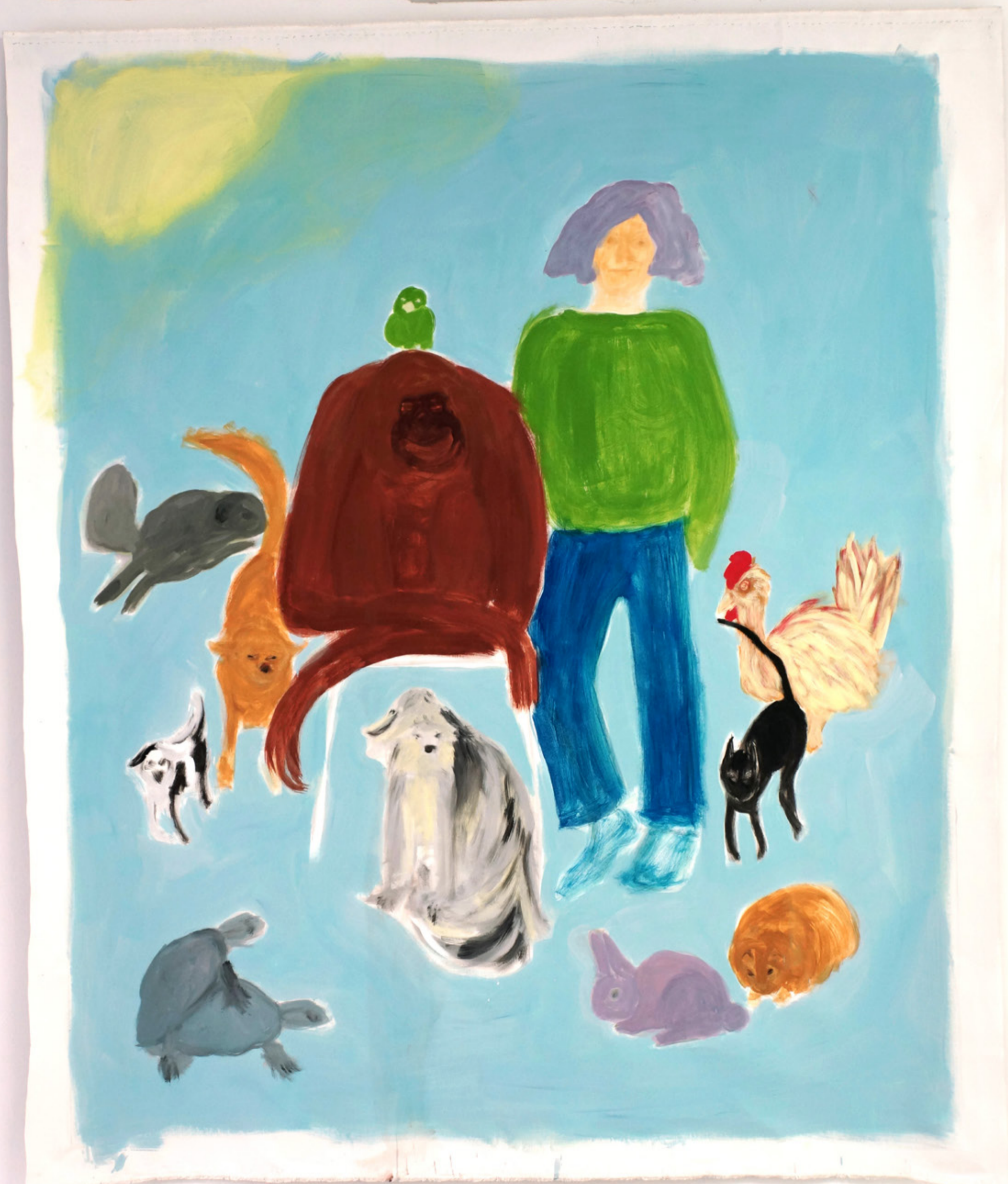
(Autoportrait avec animaux) SANS TITRE, ACRYLIQUE SUR TOILE, 210 X 180 CM, 2018