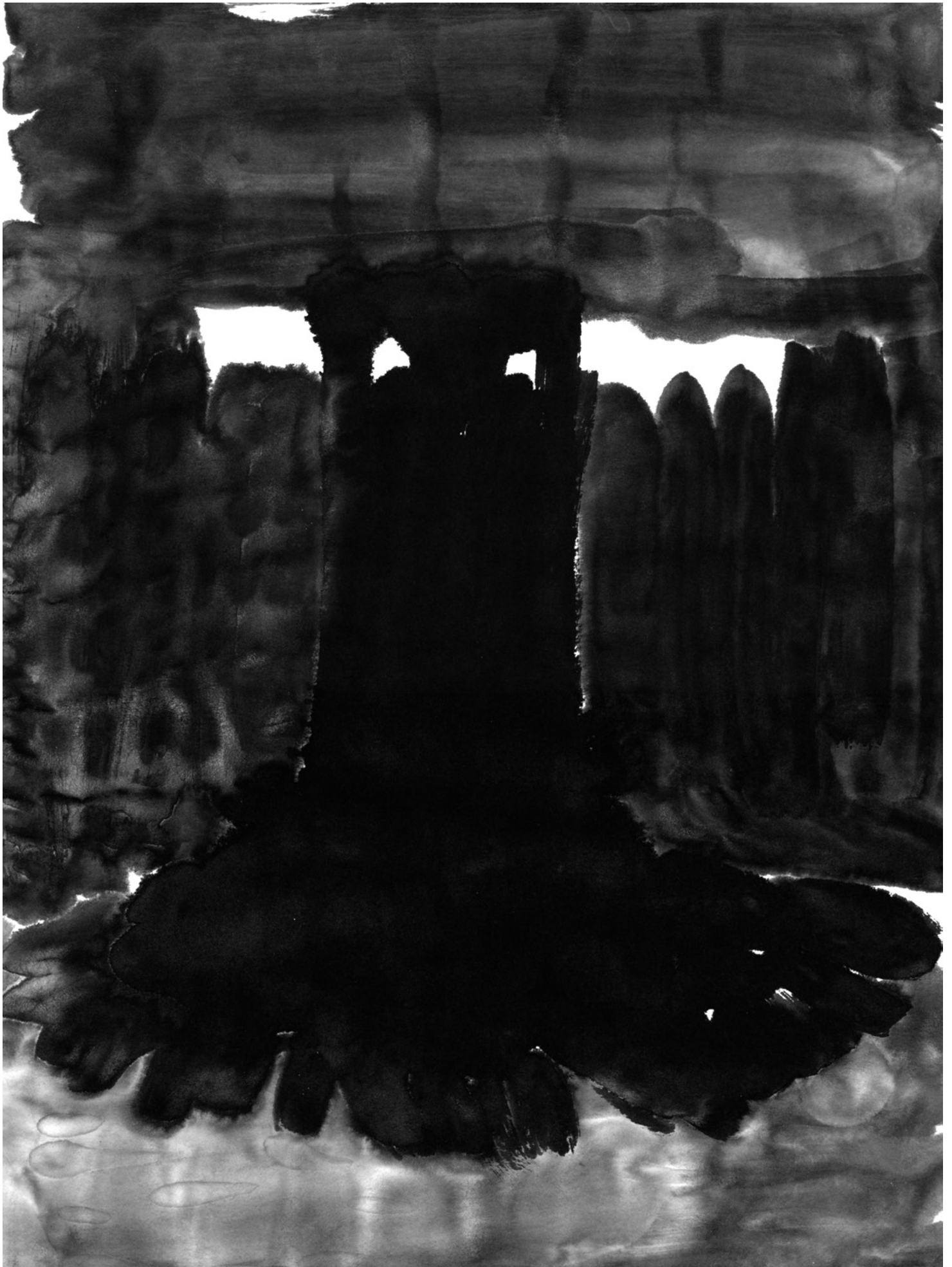
(PHARES) ENCRE DE CHINE SUR PAPIER BAMBOU, 30X40 CM, 2013