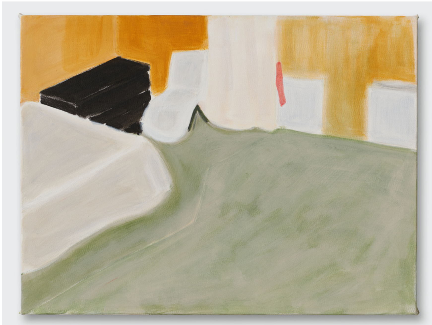
(Intérieurs) Sans Titre, 2024, Acrylique sur toile, 46 x 61 cm Collection privée