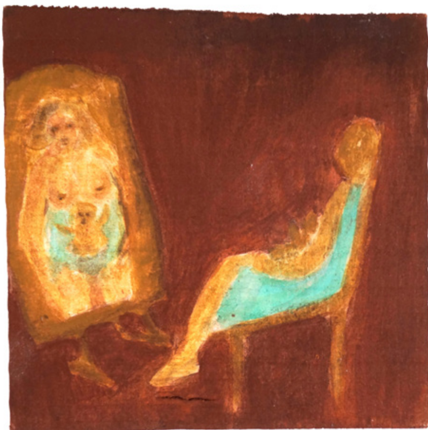
SEULE, ACRYLIQUE SUR BOIS, 15 X 15 CM, 2009