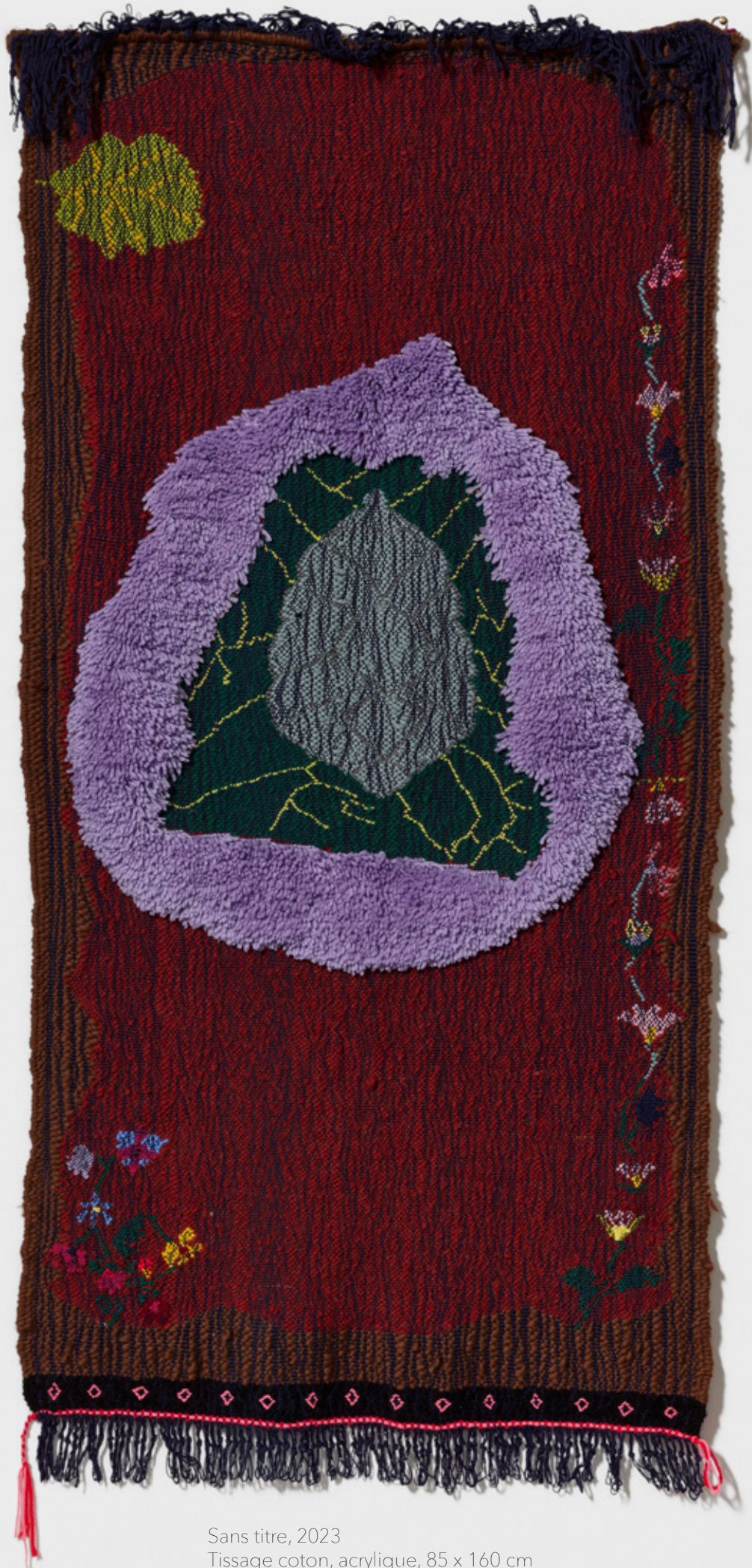
Sans titre, 2023 Tissage coton, acrylique, 85 x 160 cm Collection Frac Sud