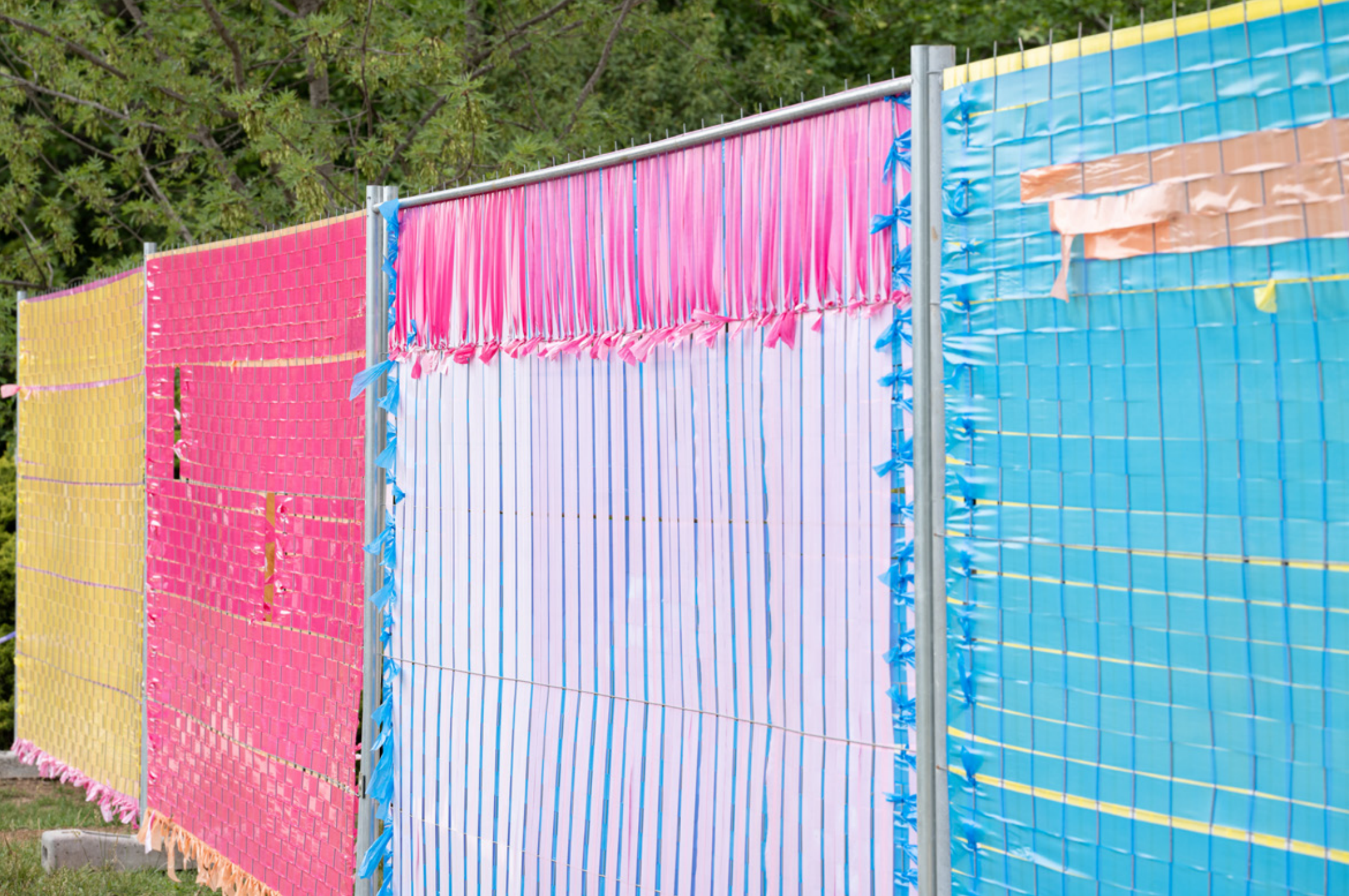
ARTS ÉPHÉMÈRES, PARC DE MAISON BLANCHE MARSEILLE JUIN 2023 IMPROMPTU, TISSAGE DE RUBALISE SUR GRILLE HERAS , 15 X 2 M