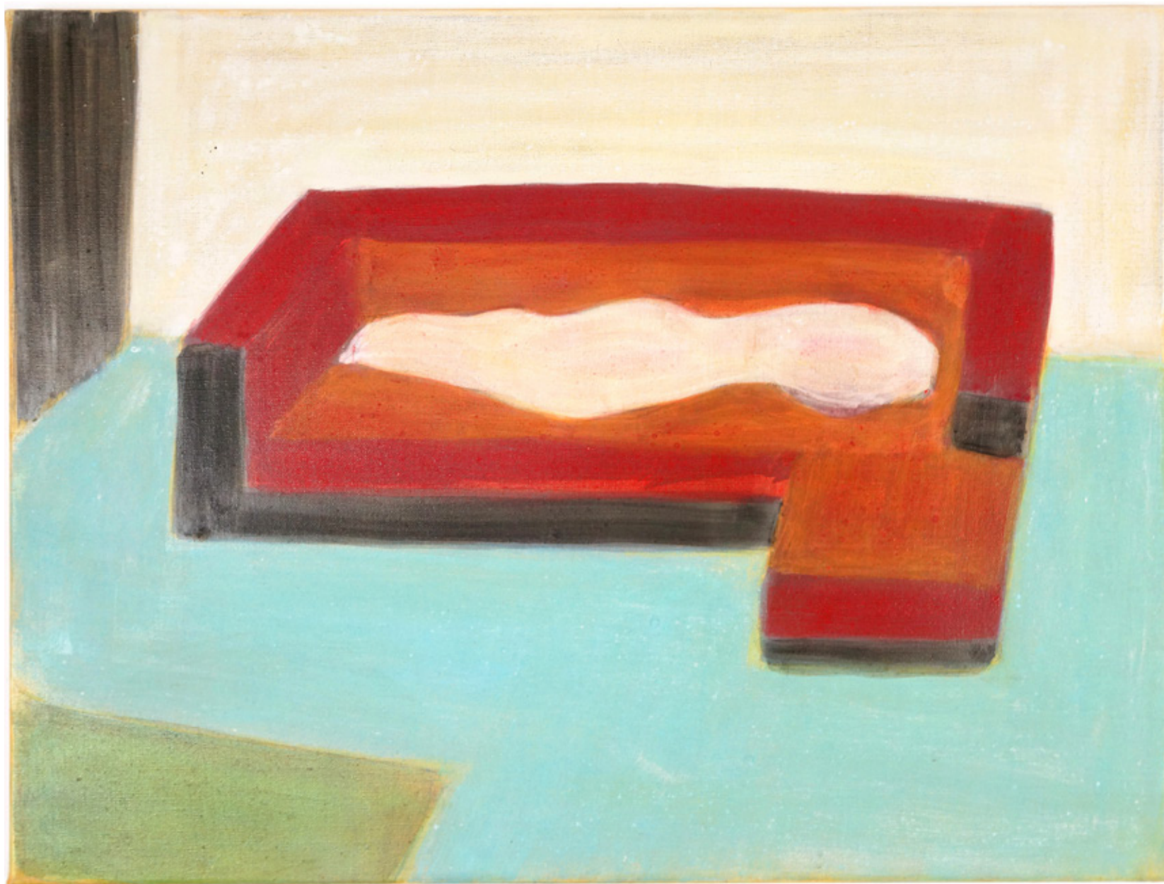
ACRYLIQUE SUR TOILE, 61 X 46 CM, 2015 Collection privée