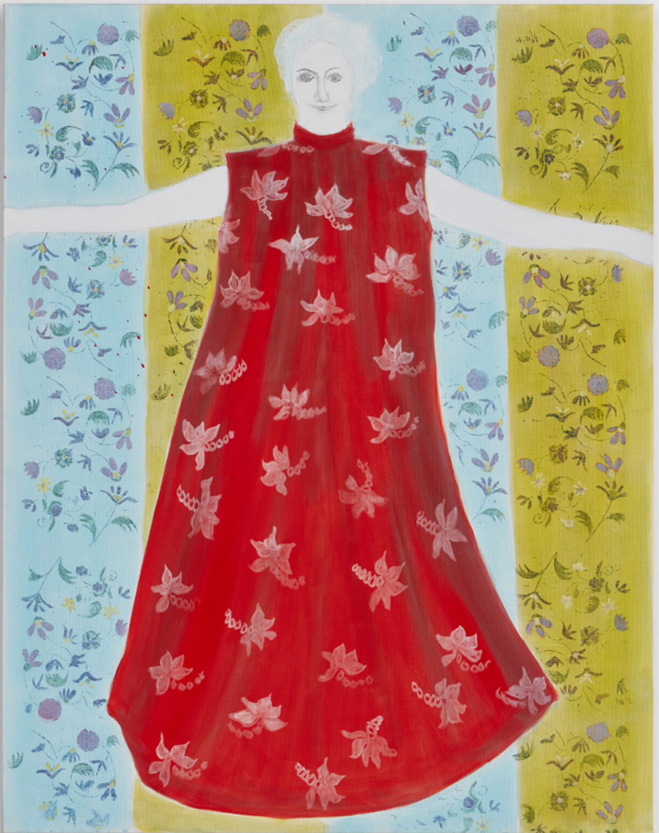
AUTO PORTRAIT (AUX ROBES) SANS TITRE , 2020, ACRYLIQUE SUR TOILE, 146 X 114 CM