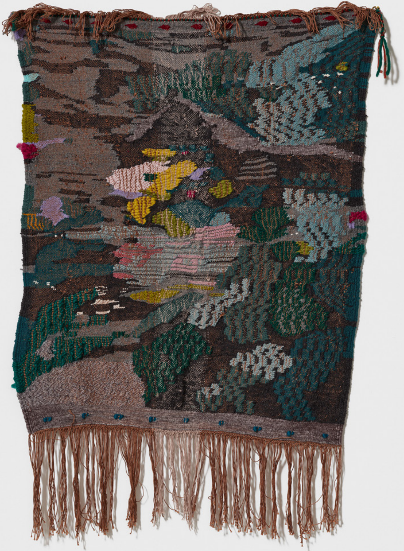
Sans titre, 2024 Tissage, laine, coton, acrylique, 90 x 120 cm