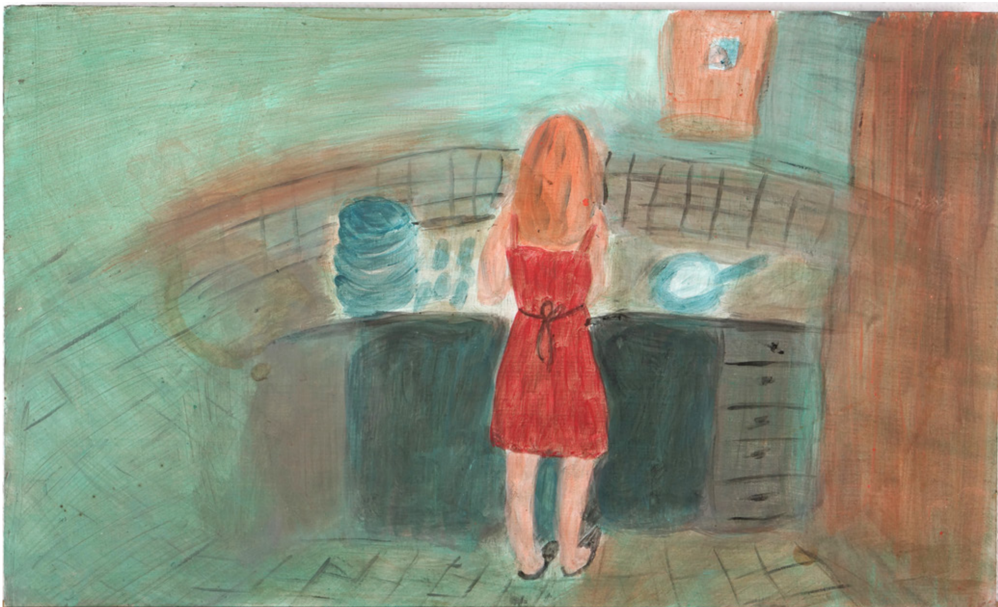
(Autoportrait au ménage ) SANS TITRE, PEINTURE À LA CIRE SUR MÉDIUM, 30 X 50 CM, 2009 Collection privée