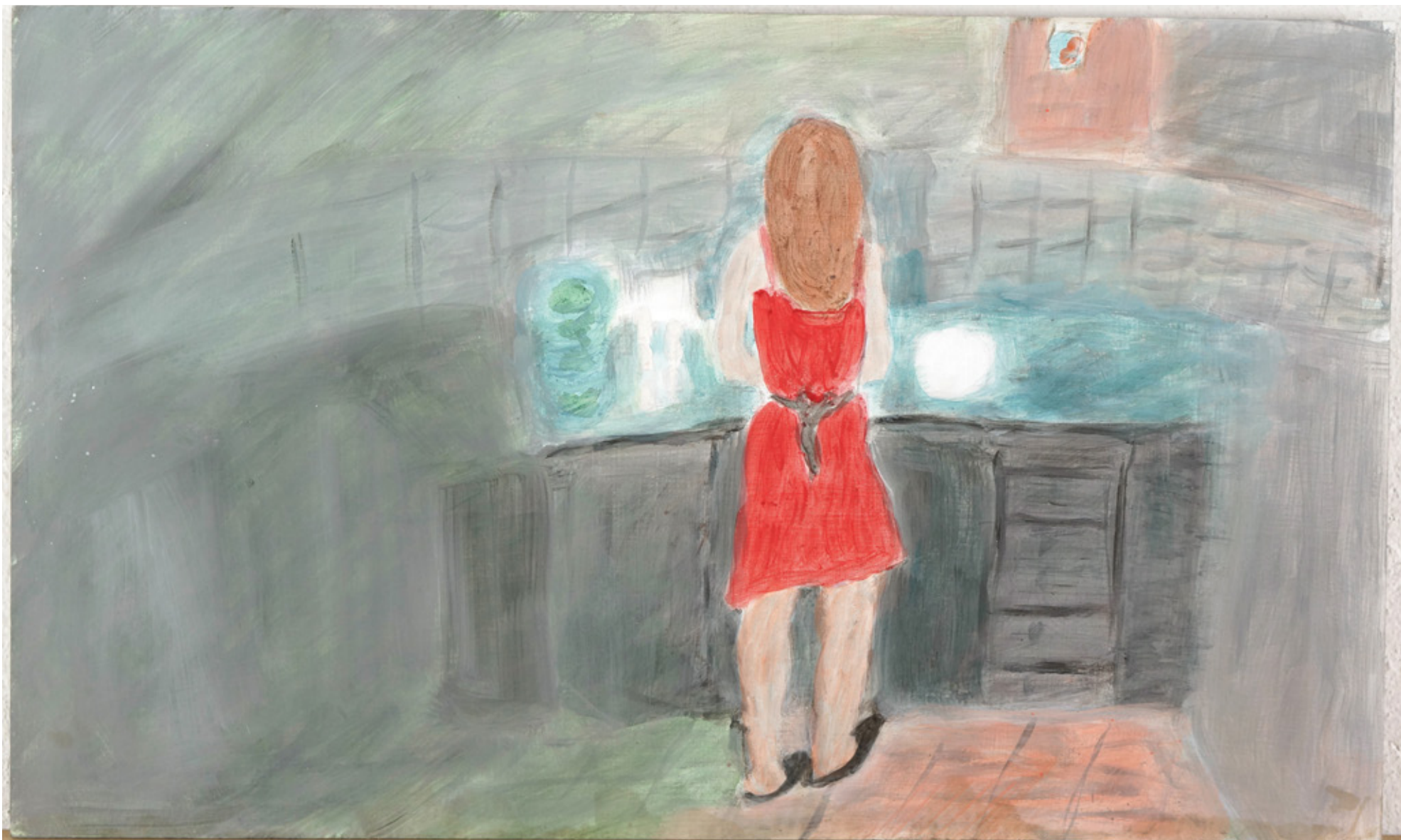
(Autoportrait au ménage ) SANS TITRE, PEINTURE À LA CIRE SUR MÉDIUM, 30 X 50 CM, 20s09 Collection privée