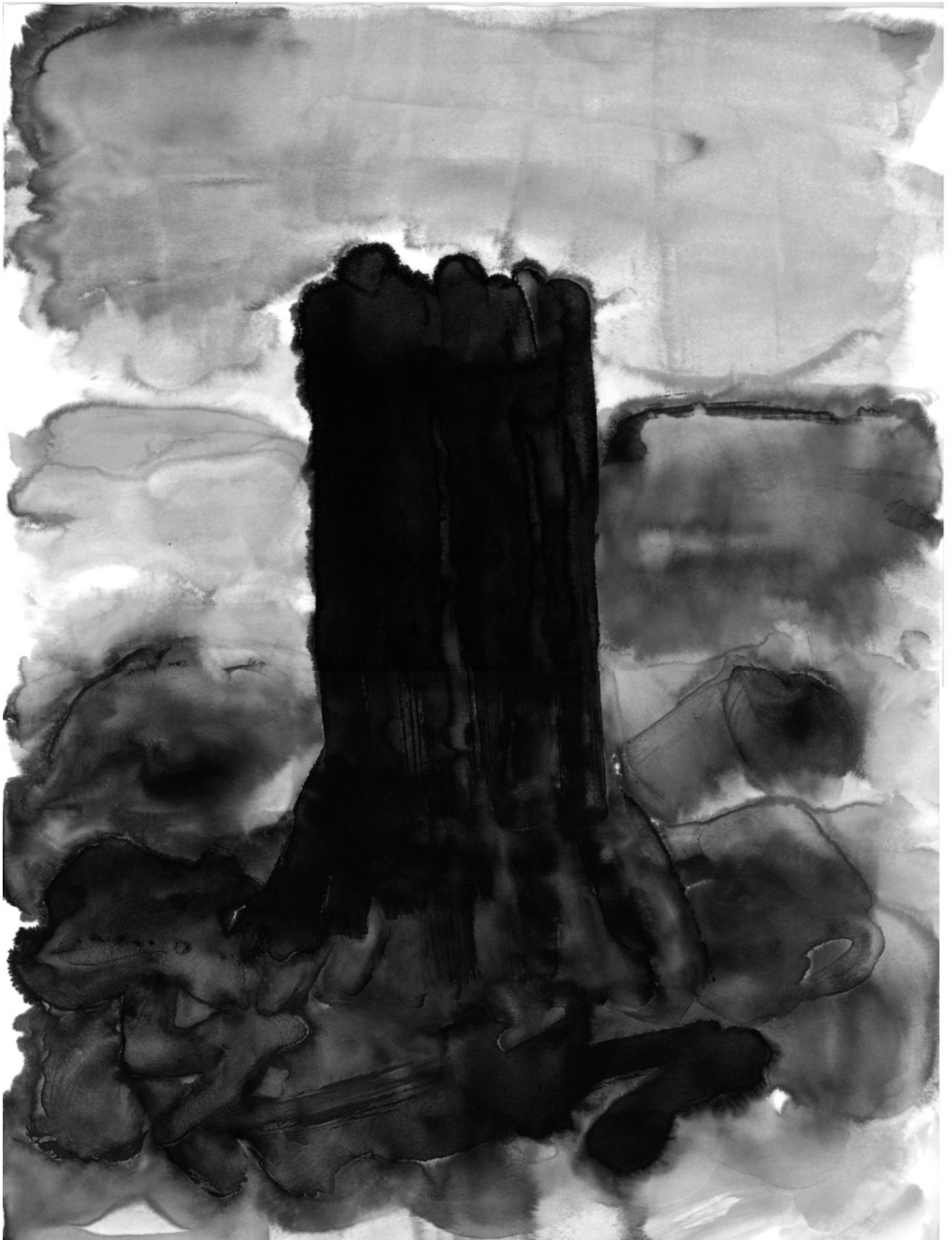
(PHARES) ENCRE DE CHINE SUR PAPIER BAMBOU, 30X40 CM, 2013