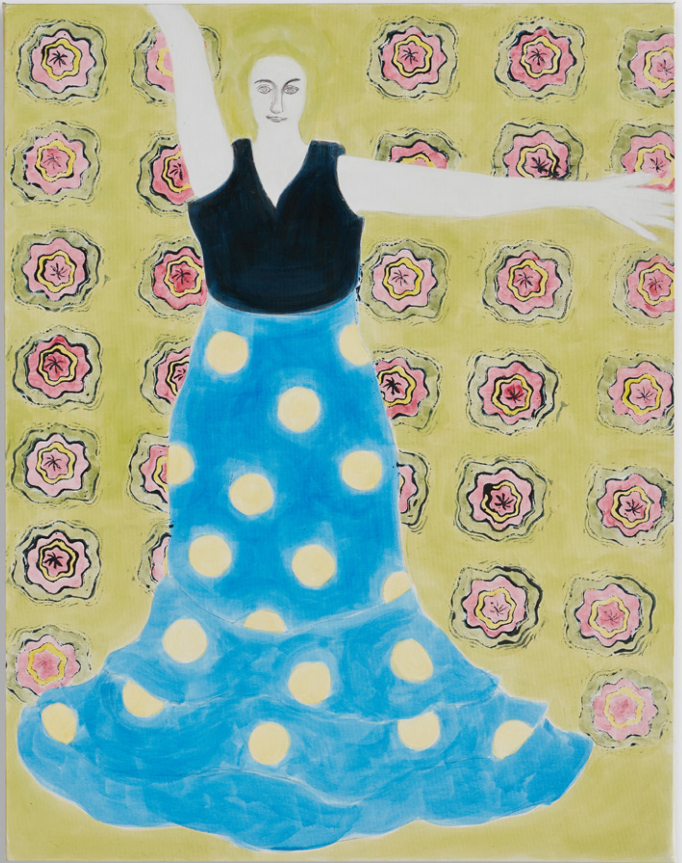
AUTO PORTRAIT (AUX ROBES) SANS TITRE , 2020, ACRYLIQUE SUR TOILE, 146 X 114 CM