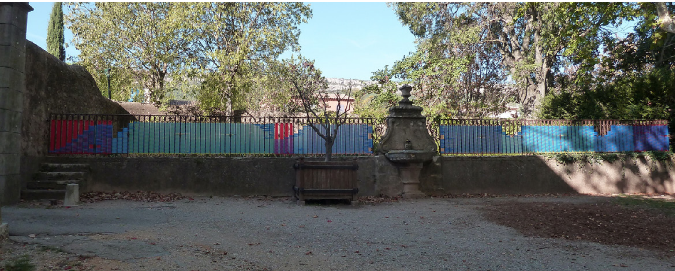
ARTS ÉPHÉMÈRES EN ITINÉRANCES, ARTEUM MAC, CHATEAUNEUF LE ROUGE, OCTOBRE 2023 RUBALISE SUR GRILLE EN FER FORGÉ, 16 X 1,20 M.