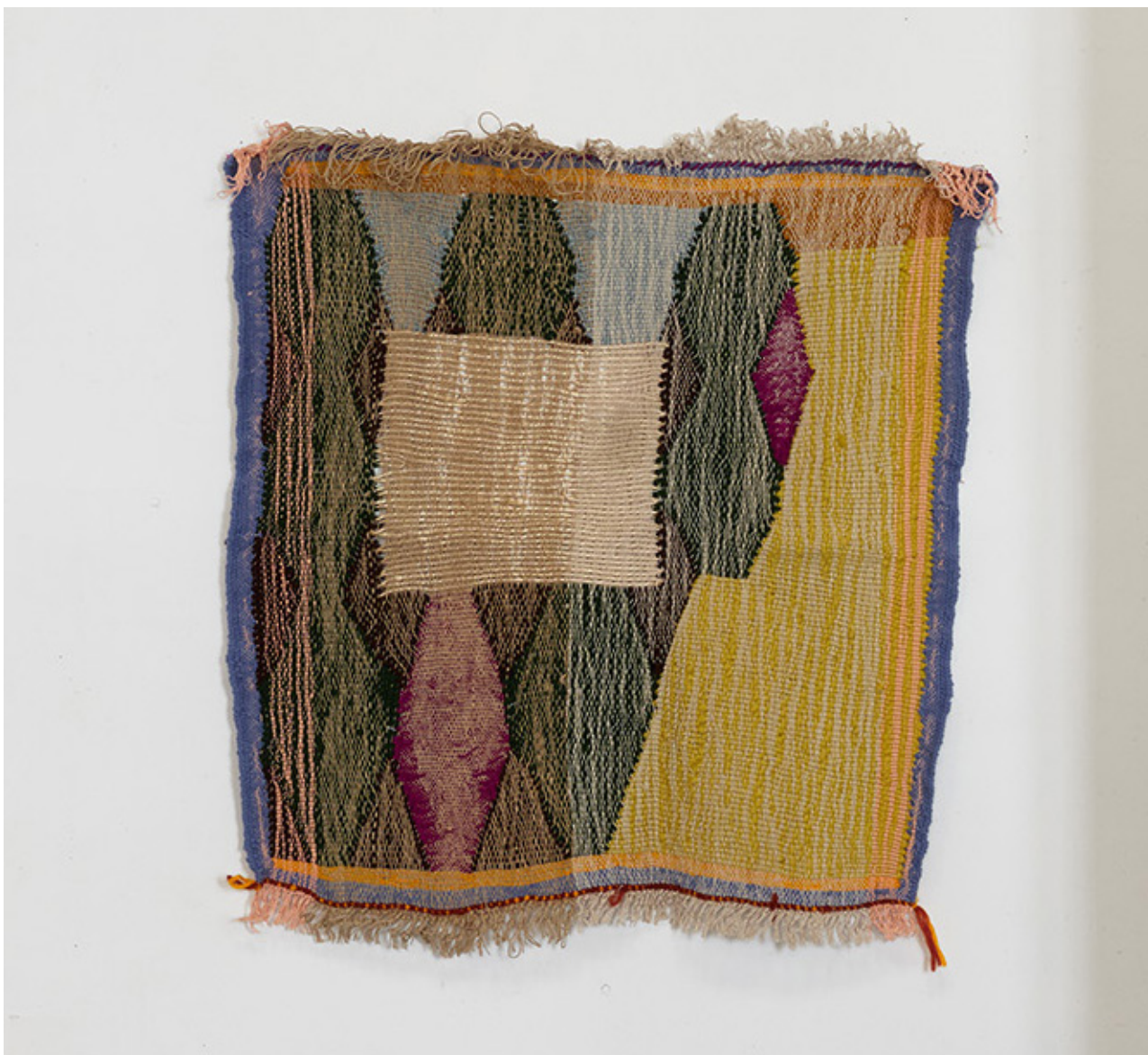
Sans titre, 2025, tissage, laine, coton, acrylique, 84 x 94 cm