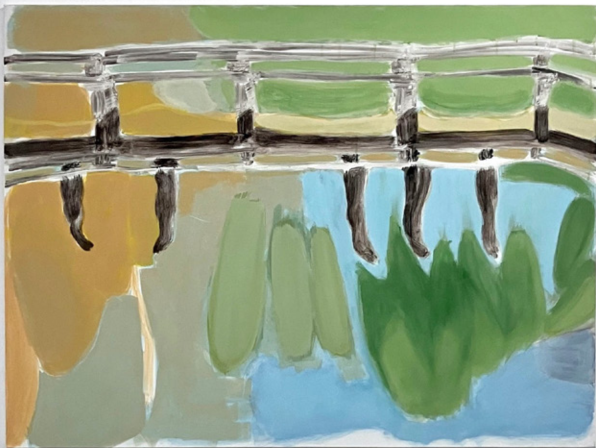
Vue d'atelier , 2026 Cire saponifiée, Pigments