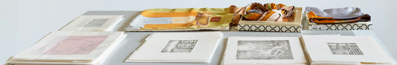
Vue d'atelier, OAA 2025, Pigments et cire saponifiée, 2025, dimensions variables