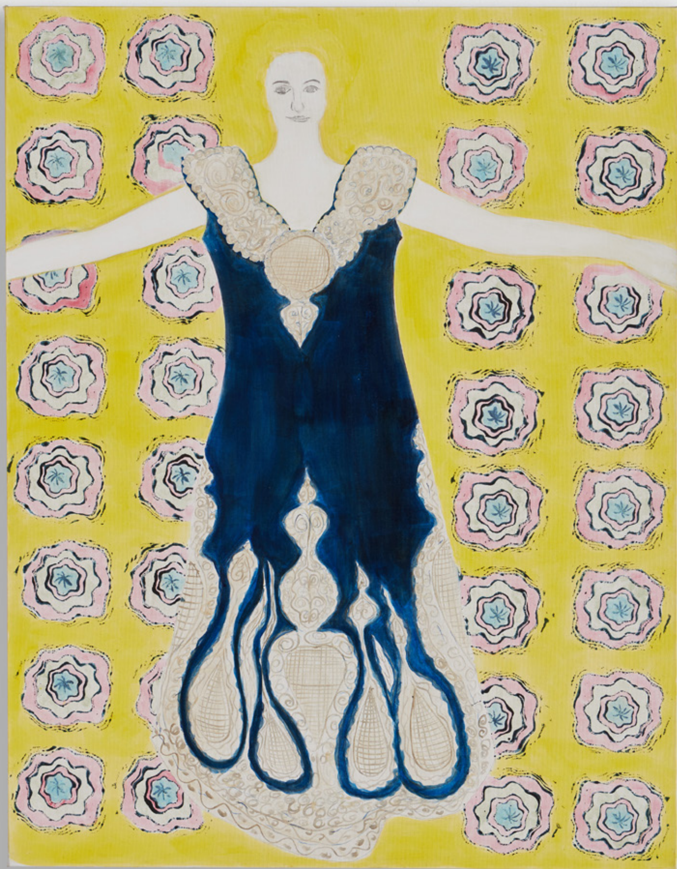
AUTO PORTRAIT (AUX ROBES) SANS TITRE , 2020, ACRYLIQUE SUR TOILE, 146 X 114 CM