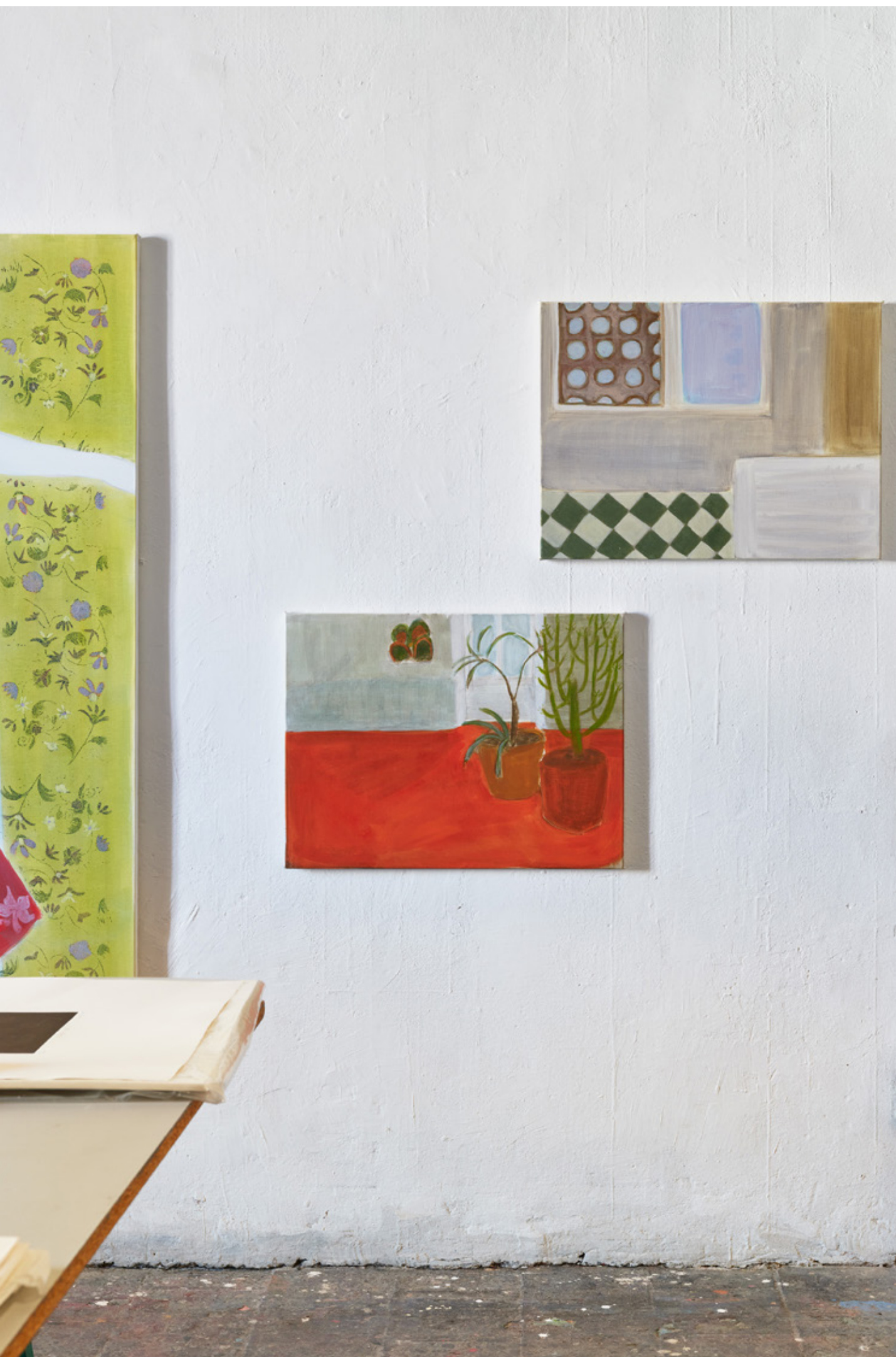
vue d'atelier, 2025 (Intérieurs)