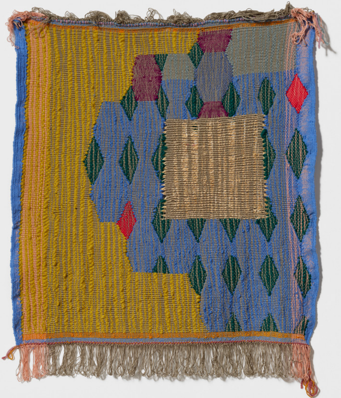
Sans titre, 2025 Tissage, laine, coton, acrylique, 86 x100 cm